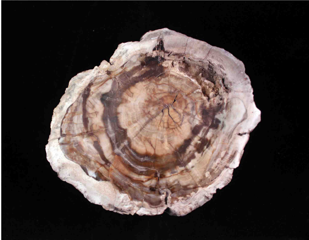
Figura 1. Sección transversal de un fósil de madera.

original hasta alcanzar la petrificación (Elliott y Foster, 2014). Según Viney (2014), la replicación de la estructura celular, es posible gracias al equilibrio que existe entre la degradación de la madera y la deposición de minerales, completándose un proceso fascinante, pero un tanto pausado. Es importante comentar que, a diferencia de otros fósiles (conchas marinas, trilobites, hojas, entre otras) que son “impresiones” o “compresiones” (fósil de hoja), la madera petrificada es una representación tridimensional del material orgánico original, tal como se observa en la figura 2B. Es una estructura en 3D que se estuvo fraguando desde hace millones de años.