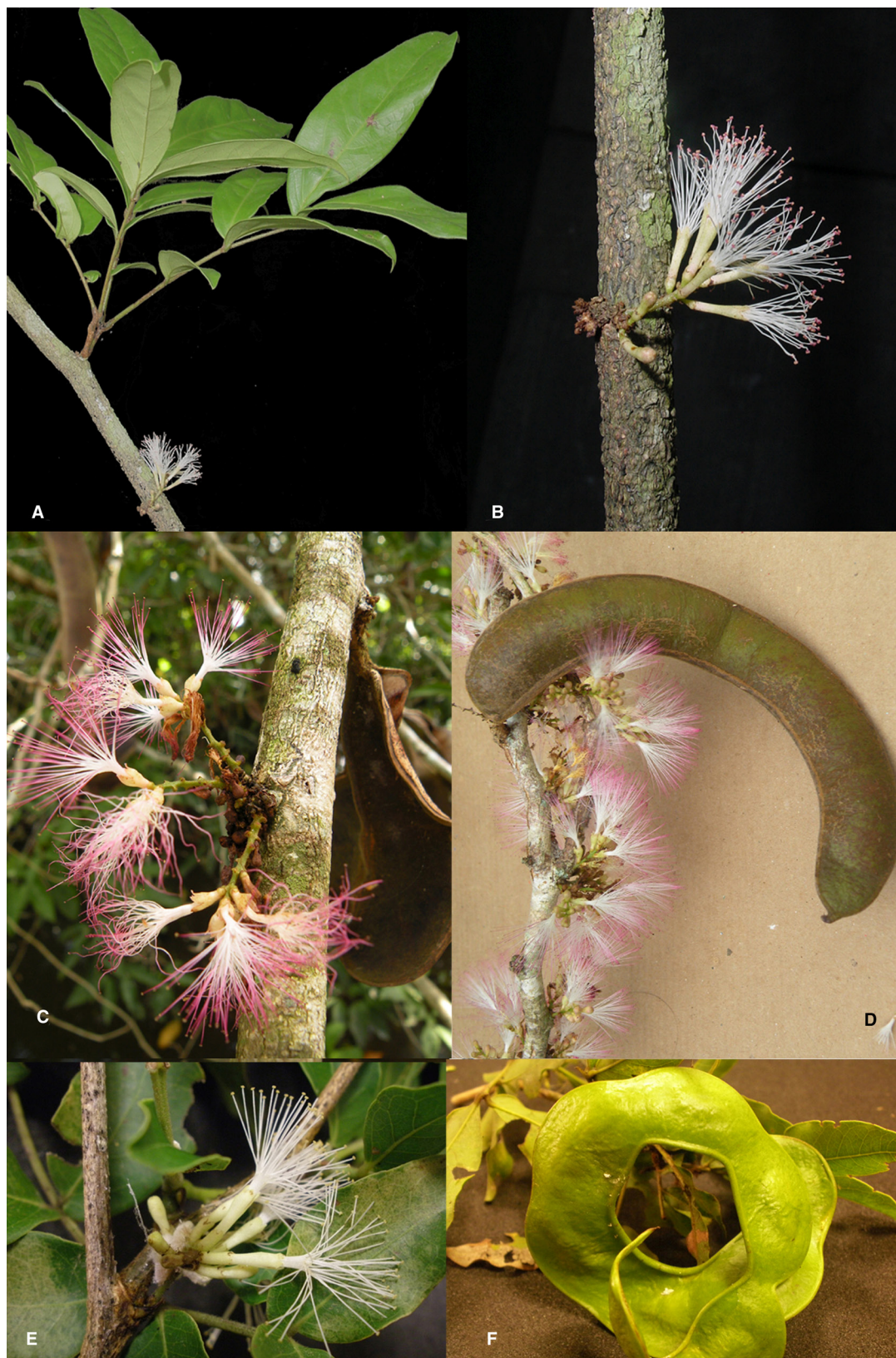
Fig. 2. Zygia en la Península de Yucatán. A y B) Z. cognata cognata ; C y D) Z. latifolia ; E y F) Z. recordii .

Distribución y ecología: Zygia cognata se distribuye en México (Campeche, Chiapas, Oaxaca, Quintana Roo, Tabasco y Veracruz), en Guatemala (Alta Verapaz) y Belice (Belice).