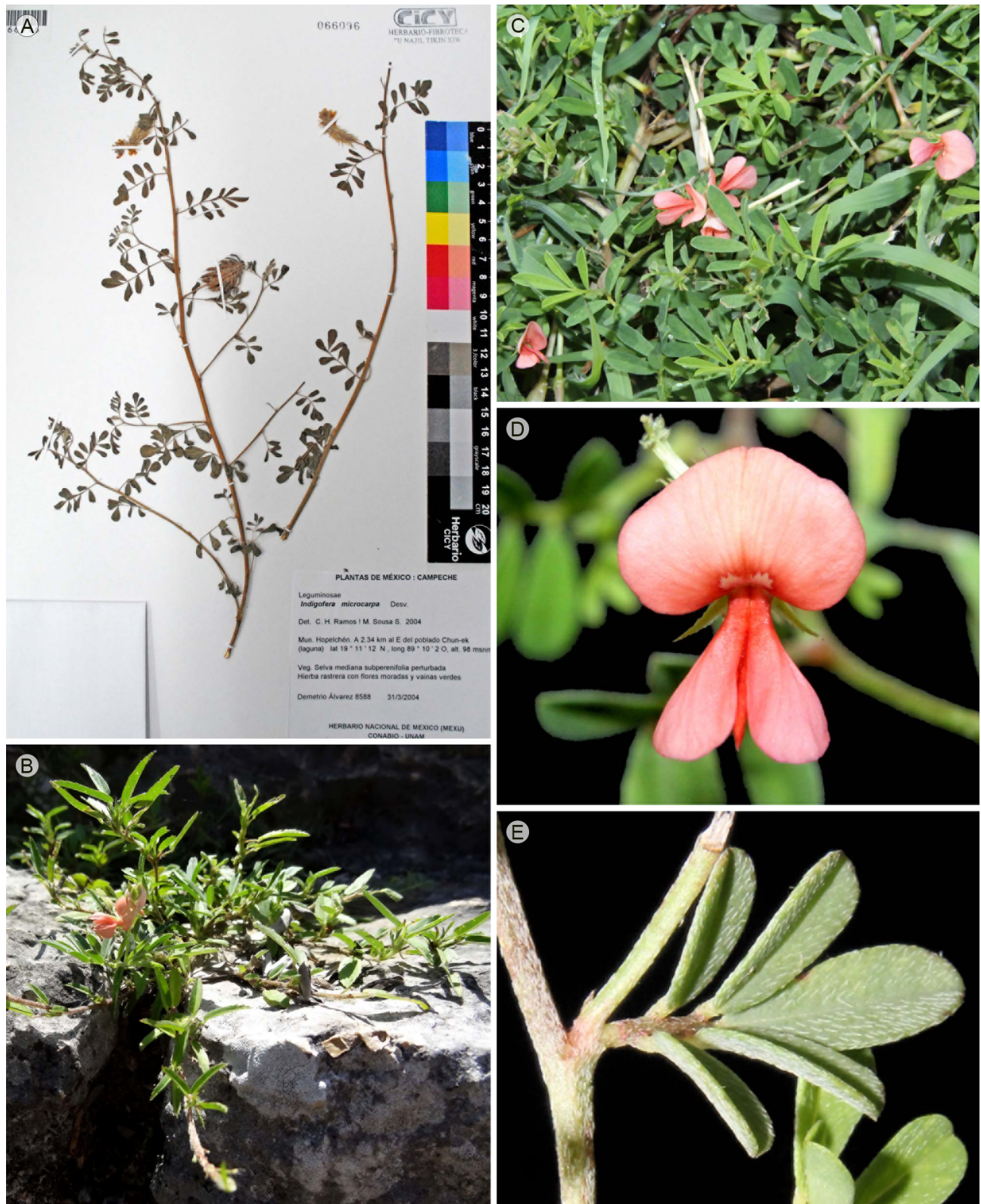
Figura 2: Nuevos registros de Indigofera L. para la Península de Yucatán, México. A. Indigofera microcarpa Desv. (D. Álvarez 8588, CICY); B-E. Indigofera miniata Ortega, B. planta en hábitat rupícola en la Zona Arqueológica de Dzibichaltun, C. planta en jardines de Campeche, D. flor, vista anterior, E. detalle de los tallos y hojas.