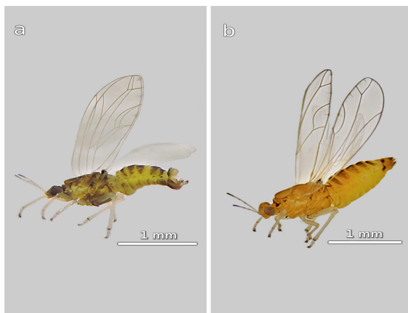
Figure 4. Trioza rusellae psyllid male (a) and female (b). Figura 4. Macho (a) y hembra (b) del psílido Trioza ruselleae .

Adult insects have similar characteristics to the family of psyllids: back-ventral shape with compressed body; color variations ranging from yellow, olive green to dark gray; male insects are smaller than female insects and have blunt-ended point on the abdomen (Figure 4a), while the abdomen of the female insects ends in a sharp point (Figure 4b). Adult insects preserve certain differences compared to D. citri (they are not brown and have no distinctive patterns spots) and T. diospyri (their body has not a shiny black color, excluding the middle and back tibia) insects. In the case of T. erytraea and T. aguacate no significant differences were observed in adult insects, except in their nymphal stages and gregarious habits, so the above characteristics match those of the T. rusellae insect according to the keys of Brown and Hodkinson (1998) and Tuthill (1974). Cuevas-Reyes et al. (2004a) reported the existence of this insect on Ramon trees. Dreger and Sorthouse (1992) and Cuevas-Reyes, Siebe, Martínez-Ramos, and Oyama (2003) said that each gall species has a specific association with a host plant.