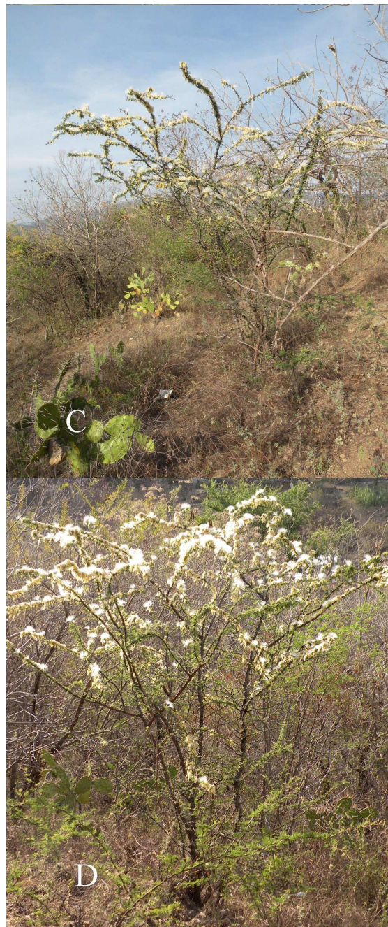
FIGURAS C-D. Sphinga acatlensis , hábito y planta en floración.

Britton, N.L. & J.N. Rose. 1928. Mimosaceae. North American Flora 23: 1-76.