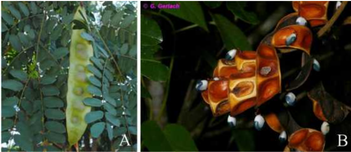
Figura 2. A. Albizia lebbeck (L.) Benth., una especie asiática ampliamente cultivada en el estado de Yucatán y muy abundante en la ciudad de Mérida. No está naturalizada en la región. B. Abarema brachystachya (DC.) Barneby & J.W. Grimes, detalles del fruto y su semillas, planta creciendo en Brasil.

mes, 1996). Hay diferencias morfológicas, ecológicas y biogeográficas que apoyan el reconocimiento de estos nuevos géneros.