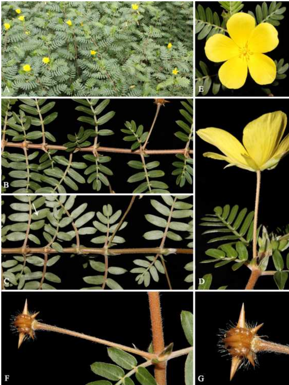
Figura 5. Tribulus cistoides . A. Hábito. B. Hoja, haz. C. Hoja, envés. D. Flor, vista de cáliz y corola. E. Flores, vista frontal. F. Fruto. G. Detalle del fruto. (Fotos: W. Cetzal-Ix).