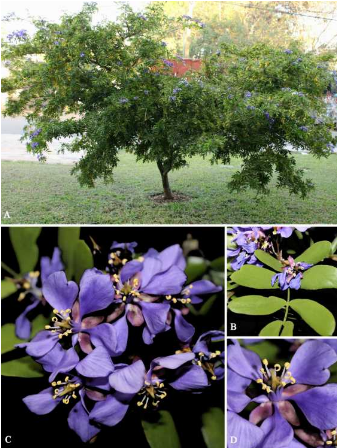
Figura 1. Guaiacum sanctum . A. Hábito. B. Hoja, haz. C. Flores, vista frontal. D. Flores, vista lateral. (Fotos: W. Cetzal-Ix).