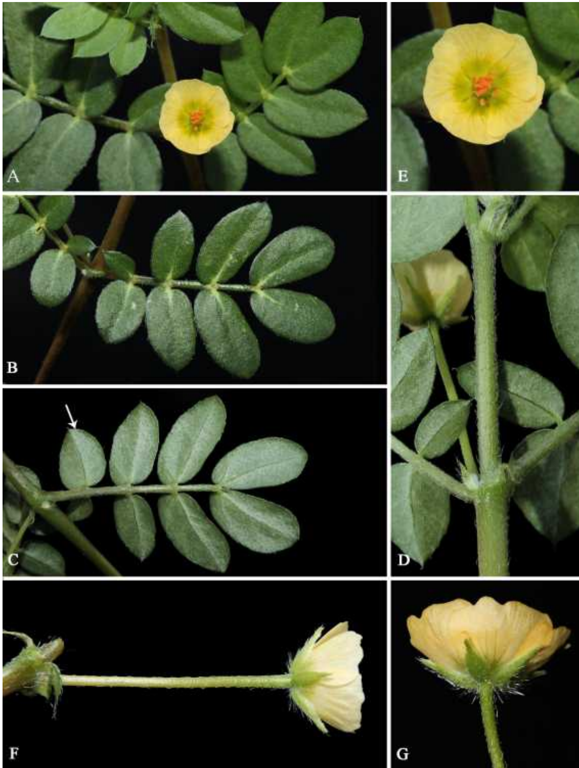
Figura 3. Kallstroemia maxima . A. Hábito. B. Hoja, haz. C. Hoja, envés. D. Detalle de la hoja y tallo y pubescencia en la superficie abaxial. E. Flores, vista frontal. F. Inflorescencia, vista lateral. G. Flor, vista lateral de cáliz y corola. (Fotos: W. Cetzal-Ix).