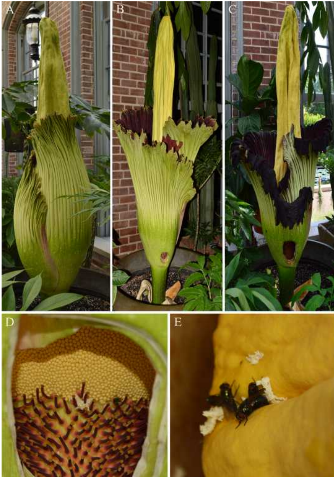
Figura 2. “Jack”, uno de los Amorphophallus titanum en el Missouri Botanical Garden. A. Inflorescencia antes de antesis. B. Mañana después de la primera noche de floración. C. Mañana después de la segunda noche de floración. D. Ubicación de las flores unisexuales en la base del espádice: Flores masculinas en la parte superior (amarillo crema) y flores femeninas en la parte inferior. E. Detalle de moscas y huevecillos. En B y C se observa un orificio que se realiza en la base de la espata, para ver la estructura interna de la inflorescencia (D).