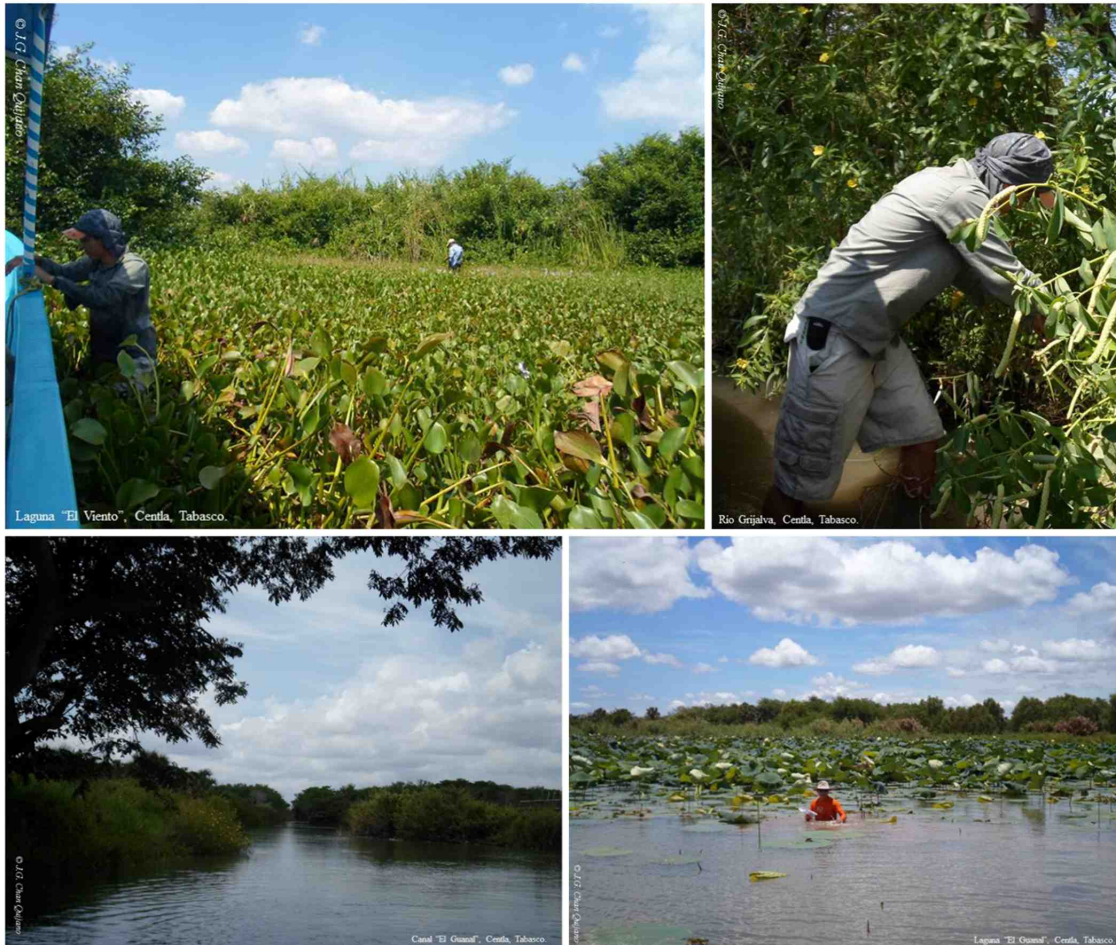
Figura 1. Recolecta de las especies vegetales en las áreas de estudio.

Novelo-Retana (2008) registró un total de 219 especies para la Reserva de la Biosfera Pantanos de Centla, mientras que en el presente trabajo se registraron, considerando todas las zonas de estudio, un total de 120 especies. Al comparar los cuatro sitios, encontramos que para la zona aledaña del Río Grijalva, ocho especies tienen la clasificación de introducidas y 12 especies no tienen presencia en las otras áreas de estudio. Para el canal El Guanab siete especies son introducidas y ocho especies no se encuentran en las otras áreas. En la laguna El Viento siete especies son introducidas y cinco especies no cuentan con presencia en las otras áreas. Por último, en la laguna El Guanab dos especies son introducidas y tres especies no tienen presencia en los otros sitios