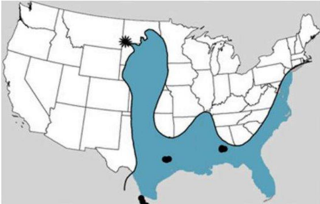
Figura 3. Localización del yacimiento paleontológico de Tanis: *Tanis; ●localidades con evidencias de tsunamis; de color azul el mar interior oeste, hacia el final del Cretácico. (Tomado de DePalma et al. 2019).

el cuarzo lo hizo 38 minutos después y dejó de alcanzarlo al transcurrir de 2 horas. Por su parte, los autores están de acuerdo que la inundación fue resultado del impacto en Chicxulub, pero descartan que haya sido resultado de un tsunami desde el sitio del impacto, porque de acuerdo a sus cálculos hubiera tardado en llegar más de 18 horas; además hubiera llegado debilitado al pasar a través de un antiguo mar poco profundo (llamado West Interior Seaway o simplemente WIS) cercano a Tanis. Así que la explicación más satisfactoria es que el impacto provocó ondas sísmicas conocidas como P, S, y Rayleigh, las cuales llegaron a Tanis 6, 10, y 13 minutos respectivamente después del impacto produciendo un seiche. Este fenómeno aunque poco conocido, se ha reportado desde 1775, el cual consiste en la generación de ondas estacionarias en ríos, estanques, lagos u otros contenedores de agua cuando las ondas sísmicas de un terremoto pasan a través de ellos (U.S. Geological Survey 2019).