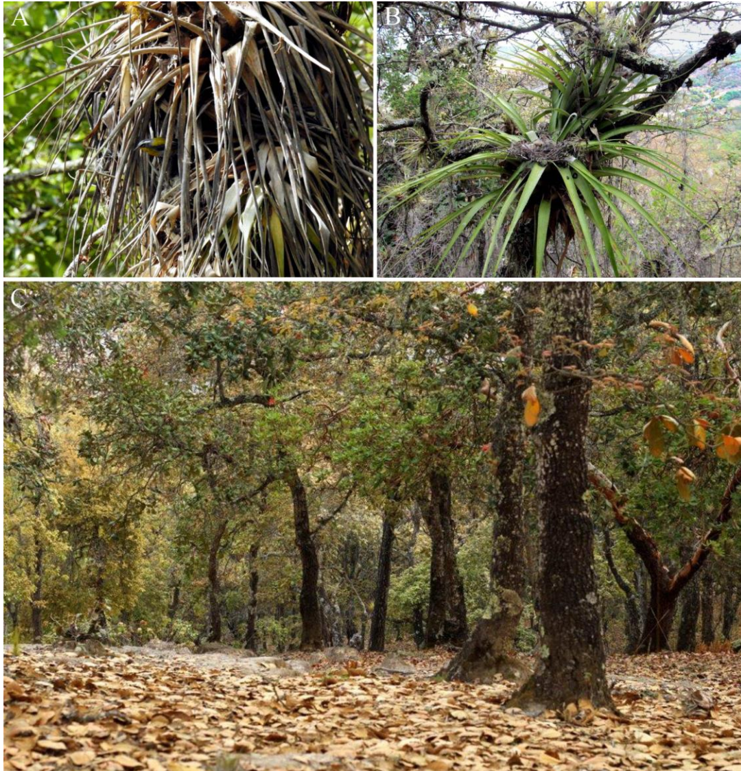
Figura 1A. El parúlido Oreothlypis superciliosa Hartlaub anidando en una Tillandsia prodigiosa (Lem.) Baker. B. Polluelo y nido de paloma en bromelia tipo tanque. C. Bosque de encino de la comunidad de Tooxi, mixteca oaxaqueña. (Fotografías: A, C. Laboratorio de epífitas. B. Octavio Orozco Ibarrola).

Sin embargo, las aves y las epífitas también son abundantes en los encinares tropicales caducifolios, que se encuentran desde el centro de México hasta Nicaragua (con el género Quercus L. extendiéndose hasta el NO de Colombia) (Kappelle 2006). Desafortunadamente, poco se sabe de las interacciones que se establecen entre aves y epífitas en este tipo de bosque; por tanto, visitamos un encinar en la Mixteca Oaxaqueña (Figura 1C), durante un año, a fin de observar qué aves visitaban a sus epífitas (básicamente orquídeas, bro-