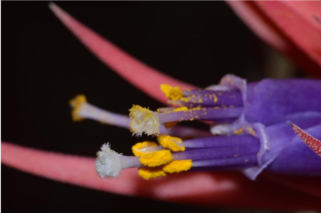
Figura 2. Flores de Tillandsia ionantha Planch., una bromelia epífita presente desde México hasta Costa Rica. La flor es en forma de tubo, los filamentos de los estambres y pétalos ambos morados, las anteras llenas de polen amarillo, el estigma se observa como un penacho de pelos blancos, donde se adhiere el polen. Aún hay que esperar que el polen germine y fecunde al óvulo. Actuamos de “Cupido” al polinizar la flor, porque los órganos sexuales no llegan a entrar en contacto.

entrar en contacto con el estigma de la misma flor, pero a veces no se tocan, pero si lo hacen, ambos deben estar “activos” (el polen viable o sano y el estigma receptivo), si no, no hay fecundación (Figura 2). Y aunque haya fecundación, puede ser que ocurra un aborto y ni se forme fruto, mucho menos las semillas. Puede deberse a problemas de compatibilidad (o falta de). Pero hay otro detalle: muchas plantas engrosan las paredes del ovario y producen “frutos” aunque no tiene semillas, algo así como embarazo imaginario...se llama partenocarpia. La vida sexual de las plantas es más complicada de lo que al menos yo