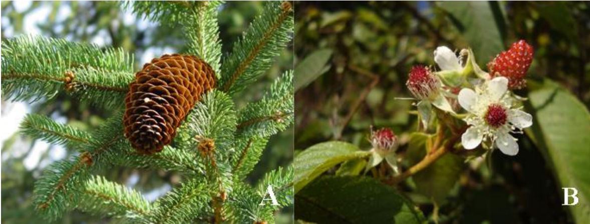
Figura 1. Órganos reproductivos de espermatofitas. A. Una fotografía de una especie del género Pinus mostrando su cono, donde las semillas quedan expuestas, desnudas. B. Rubus idaeus L., una especie de la familia Rosaceae (misma que incluye a la almendra, a la manzana, a los duraznos, etc.). La flor en el centro muestra muchos ovarios –los rojos– y en la parte de arriba de cada uno, sus estigmas, donde aterriza el polen. El fruto muestra muchas pelotitas, cada una es un ovario fecundado, un frutito, en conjunto constituyen un fruto agregado. (Fotografías: A. Ivón Ramírez Morillo, B. Katya Romero-Soler).

suerte se formará el fruto y tendrá semillas, como dicen los chicos de ahora, tendrá su “bendición”.