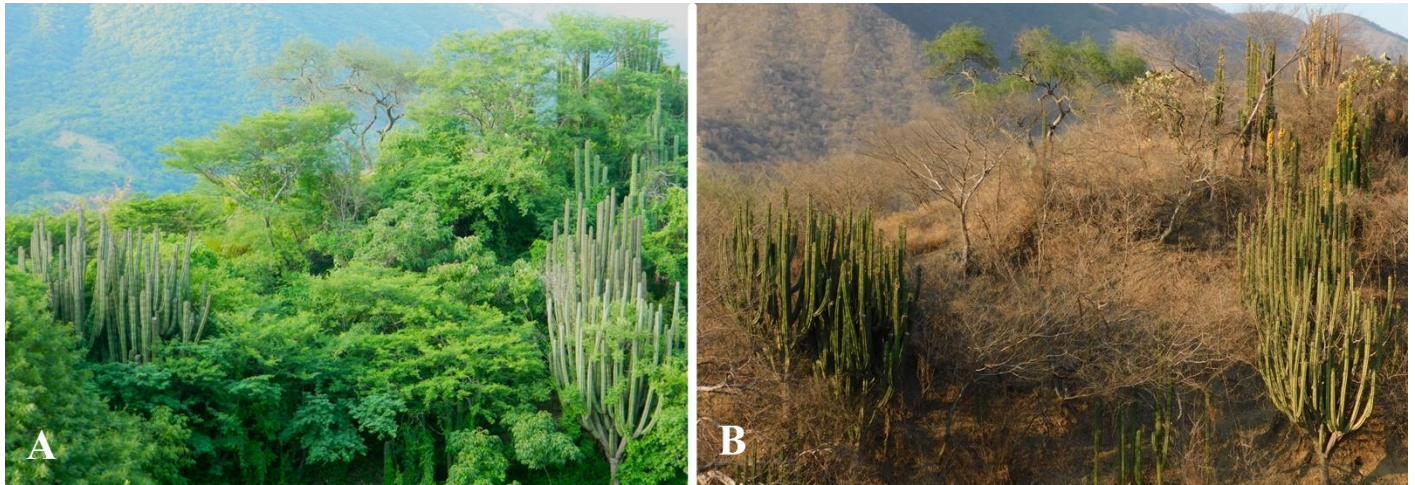
Figura 1. Fenología de un bosque tropical caducifolio en Amatlán de Cañas, Jalisco durante el periodo de lluvias (A) y secas (B).

impresionan por su gran tamaño. Además, el uso agrícola y pecuario de terrenos donde ocurren los bosques secos ha ocasionado que gran parte de su área de distribución original haya sido transformada o degradada; así que muchos de los bosques secos que observamos a nuestros alrededores en realidad son vegetación remanente que se encuentra inmersa en paisajes modificados por el hombre (Portillo-Quintero y Sánchez-Azofeifa 2010). Esta vegetación remanente frecuentemente es vegetación secundaria (es decir aquella que se regenera después del desuso y abandono de áreas donde se transformó o eliminó a los bosques secos originales) por lo que suelen ser comunidades vegetales todavía menos exuberantes, con árboles más chaparros y densos, casi impenetrables y además espinosos. Sin embargo, estos bosques secundarios juegan un papel muy importante para la conservación de la biodiversidad y para la mitigación del cambio climático, entre otros servicios ambientales.