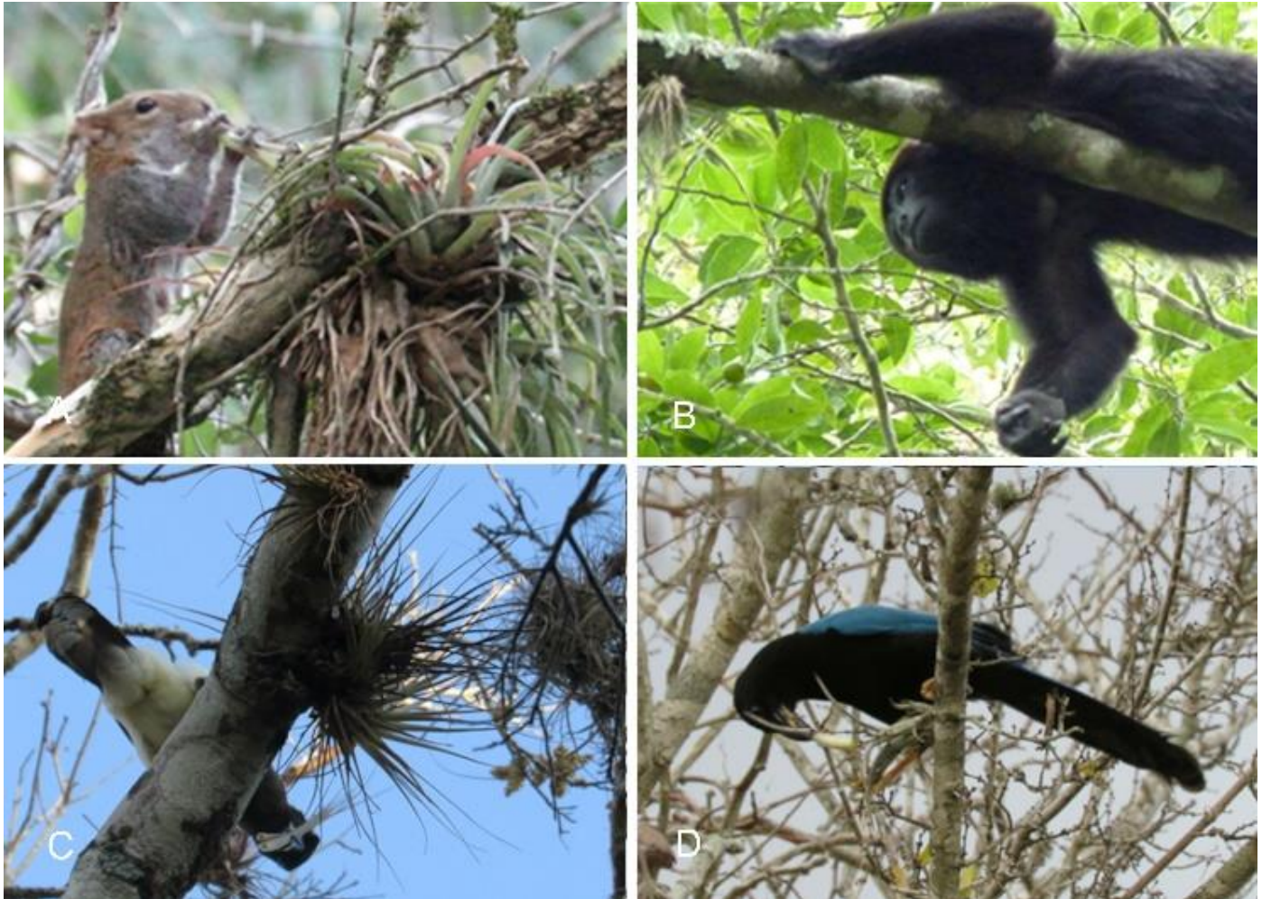
Figura 3. Vertebrados deshojan y mascan las bases de las hojas de las bromelias epifitas. A. Ardilla ( Sciurus deppei ) con Tillandsia brachycaulos , B. Saragüato ( Alouatta pigra ) y con Tillandsia fasciculata , C. Chara Pea ( Psilorhinus morio ) con Tillandsia fasciculata , D. Chara Yucateca ( Cyanocorax yucatanicus ) con Tillandsia yucatanana . Las fotos A, B y C fueron tomadas en la Reserva de la Biósfera Calakmul y la foto D en una selva baja caducifolia al norte de Mérida, Yucatán.

vertebrados de bosques estacionalmente secos pudieran acceder a fuentes de agua que, si bien son pequeñas, pueden ser más constantes que las lluvias durante la sequía (Chávez-Sahagún et al. 2019). En bosques más lluviosos, monos del género Ateles han sido reportados bebiendo agua directamente de los tanques de las bromeliáceas (Campbell 2008, citado en Gómez-Escamilla et al. 2007), teniendo estos sitios mayor diversidad y abundancia de especies de bromeliáceas con tanques de alta capacidad de almacenaje.