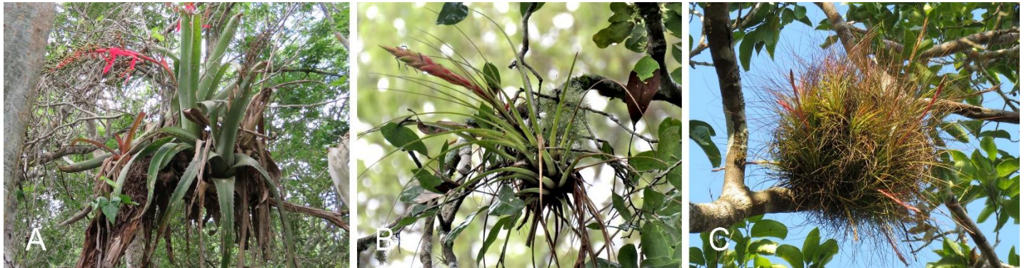
Figura 1. Formas de vida de las Bromeliaceae epífitas. A. Aechmea bracteata posee un tanque profundo, B. Tillandsia fasciculata posee un tanque más pequeño, hojas alargadas que también podrían interceptar neblina, C. Tillandsia juncea posee la forma típica de nebulofita, con hojas casi aciculares que son eficientes interceptando neblina.

de sus hojas dispuestas en forma de roseta (Benzing 2000), llamado fitotelmata o tanque (Figura 1). Otra estrategia se ve en las plantas llamadas nebulofitas (Figura 1), las cuales presentan hojas alargadas y delgadas que se especializan en interceptar y así “cosechar” el agua de la neblina (Martorell y Ezcurra 2007). Una estrategia más es la succulencia, la cual se refiere al almacenamiento de agua en el interior de las células de la planta (Benzing 2000).