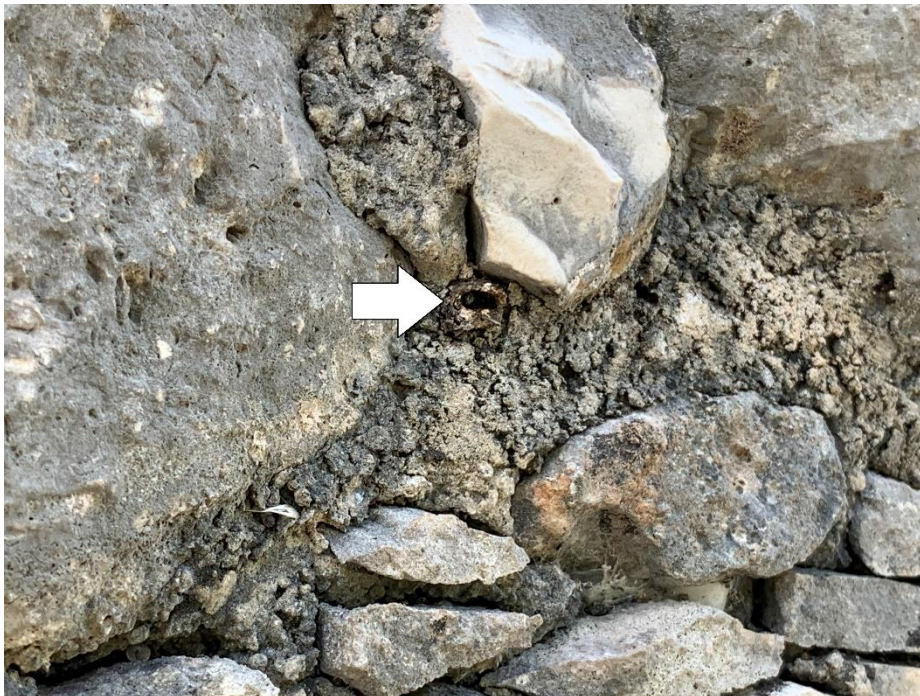
Figura 3. Entrada de nido de Plebeia sp. en una pared de mampostería. Al centro de la imagen se observa a una abeja guardiana.