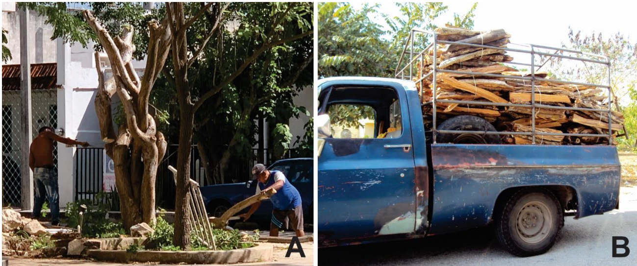
Figura 1. Destrucción de nidos de especies de ASA; A) Tala de un árbol de Chakaj ( Bursera simaruba (L.) Sarg.) en una colonia de la ciudad de Mérida, Yucatán, México, B) Vehículo transportando madera para leña o carbón en áreas alrededor de la ciudad (Fotografías: Chavier De Araujo).

Otra de las abejas que se pueden encontrar y que sus entradas son poco visibles son del género Plebeia Schwarz (Us-Kab, en lengua maya). Se trata de una abeja de longitud corporal de 4 a 5 mm (Michener 2007), de color oscuro, temperamento dócil, que pueden ser observadas en las entradas de sus nidos con una o dos abejas guardianas. Son algo tímidas ya que al acercarse a su entrada se esconden al interior, pero toleran la presencia mientras no se produzca movimiento delante de su entrada. Su entrada