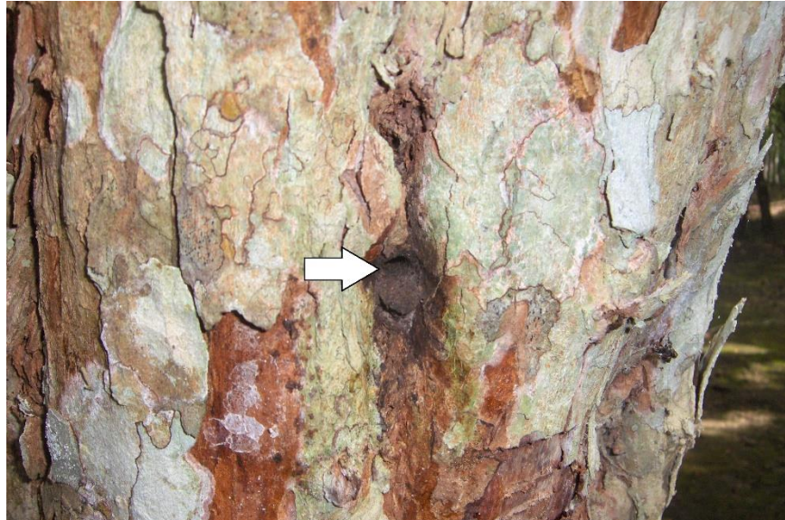
Figura 4. Entrada de nido de Cephalotrigona sp. en tronco de un árbol.

en forma de lengua de color oscuro elaborado con resinas, dirigida hacia abajo como si fuera una pequeña rampa de unos 8 a 10 mm (Figuras 4 y 5). El resto de la entrada del nido se mimetiza con su entorno a pesar del pequeño tamaño que tiene, y en ella se puede observar una abeja guardiana la mayor parte del tiempo