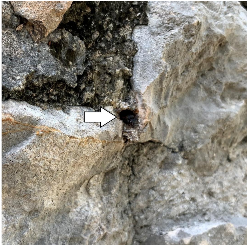
Figura 6. Entrada de un nido de Frieseomelitta nigra Cresson, en una pared de mampostería.

gos se queden pegados en ella (Figura 7). En la Figura 7 se observa un engrosamiento de la entrada del nido con resinas, debido a que a pocos centímetros se encuentra otra especie de abeja nativa Scaptotrigona pectoralis (Kantsac, en maya), donde se visualizan algunas de ellas muertas y pegadas a la resina. Igualmente, pueden hacer una distribución radiada y circular sobre la superficie alrededor de su entrada con gotas de resina para defenderse de hormigas, que conforme se van secando las van reponiendo. Este mecanismo de defensa de F. nigra delata su presencia a la vista humana (Figura 8).