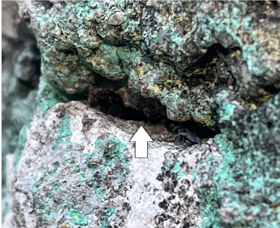
Figura 2. Entrada de nido de Trigonisca sp. en una columna de mampostería.