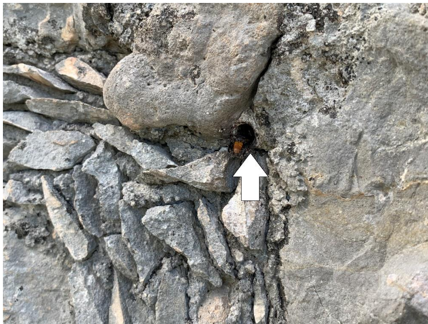
Figura 5. Entrada de nido de Cephalotrigona sp. en pared de mampostería.